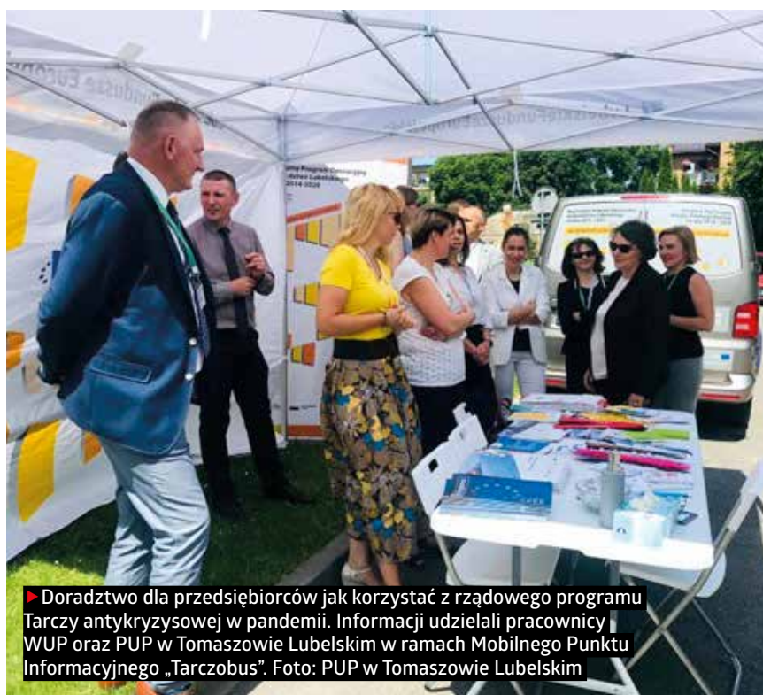
► Doradztwo dla przedsiębiorców jak korzystać z rządowego programu Tarczy antykryzysowej w pandemii. Informacji udzielali pracownicy WUP oraz PUP w Tomaszowie Lubelskim w ramach Mobilnego Punktu Informacyjnego „Tarczobus”.